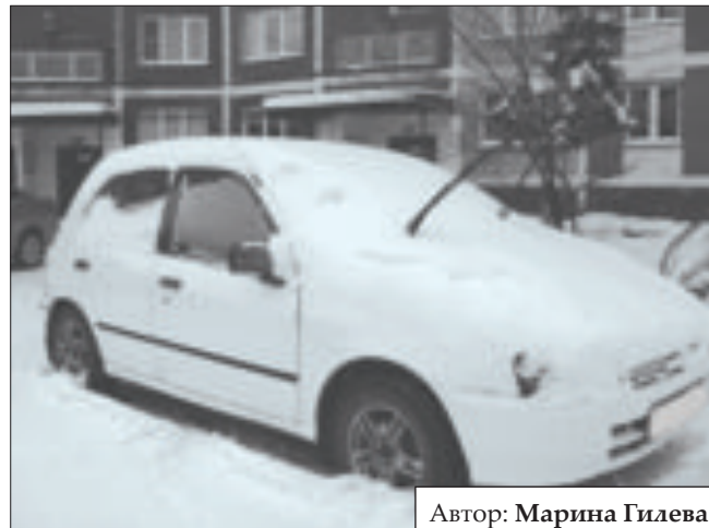
Автор: Марина Гилева

Представляем твоему вниманию фотографии юных воспитанников объединения «Фото». Они увидели и запечатлели наступление зимы и первых морозов в Новокузнецке.