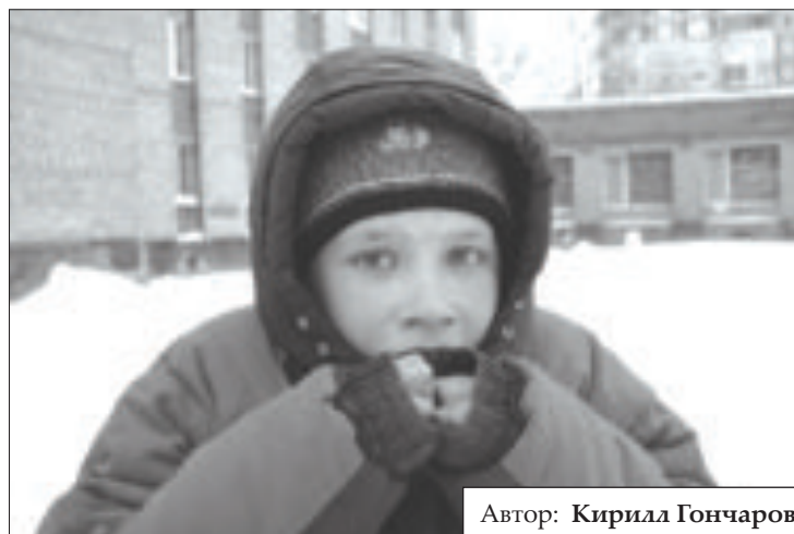
Автор: Кирилл Гончаров