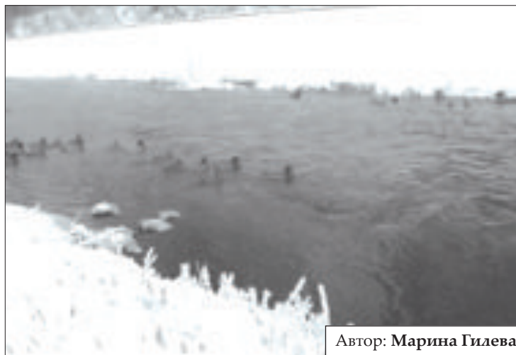
Автор: Марина Гилева